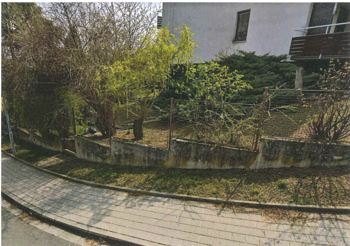
Pohled na oplocenou zahradu u rodinného domu Jírovceva 46 ve vlastnictví manželů Kostrhunových