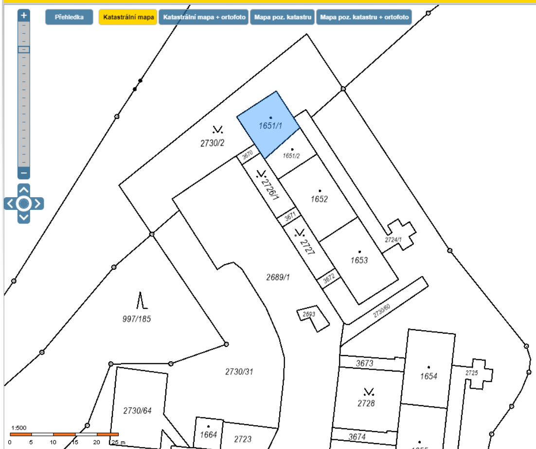
Pozemek p.č. 1651/1 v k.ú. Kohoutovice, obec Brno