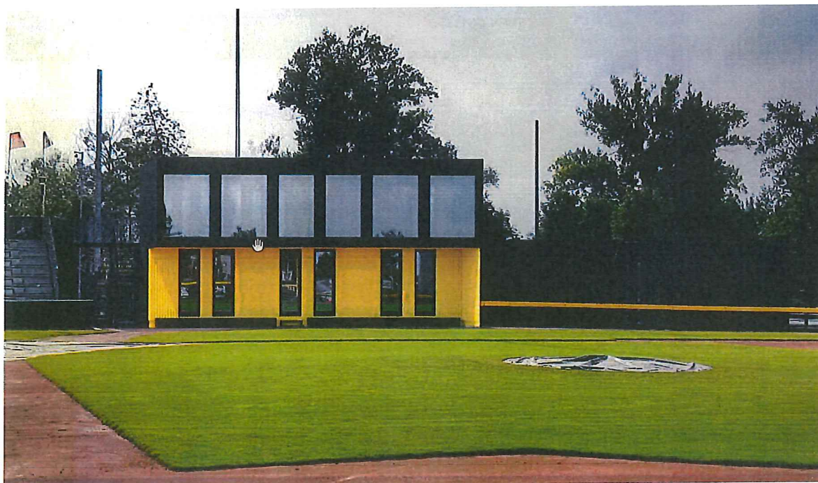
Vizualizace – hlavní stadion – pohled I

Na základě výše uvedené zvyšující se poptávce po rozšíření zázemí začal oddíl SK Draci Brno cca v roce 2019 (s vědomím vlastníka – společnosti STAREZ – SPORT) pracovat na projektu – Navýšení sociálního zázemí“. Byla zpracována studie, která vymezila možnosti z hlediska proveditelnosti napojení sítí a také z hlediska ekonomické hospodárnosti. Jako nejvhodnější varianta se ukázal systém montovaných kontejnerových staveb, který je investičně akceptovatelný a současně velmi variabilní. Tuto podobu projektu v dalších fázích projektové přípravy již zaštitil a financoval vlastník areálu – společnost STAREZ – SPORT, a.s.