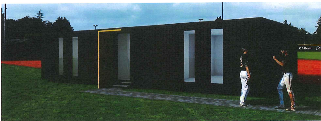
Vizualizace – juniorské hřiště