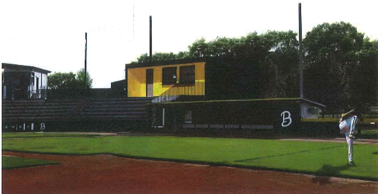
Vizualizace- hlavní stadion – pohled II