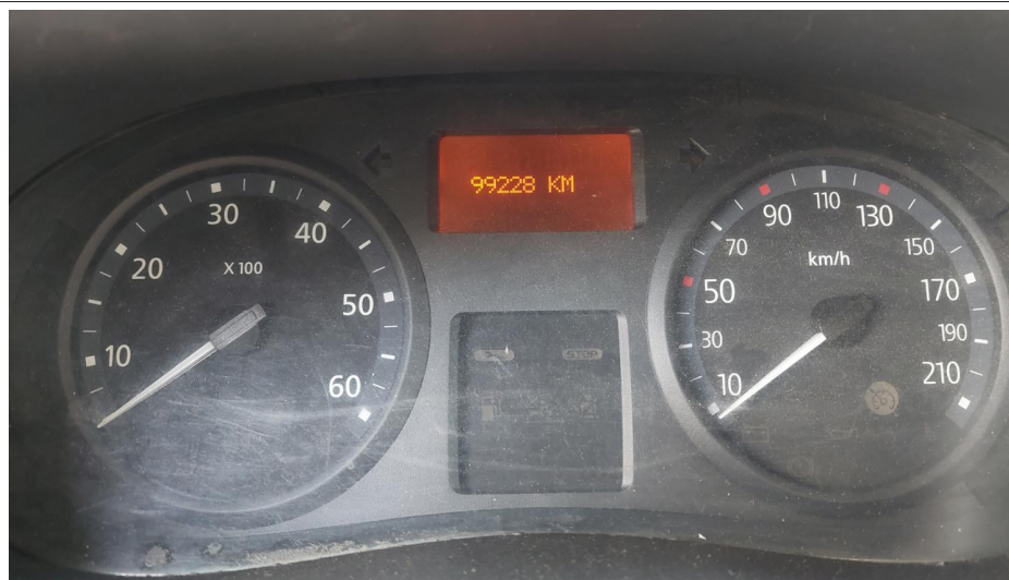
Obr. Fotodokumentace -základní