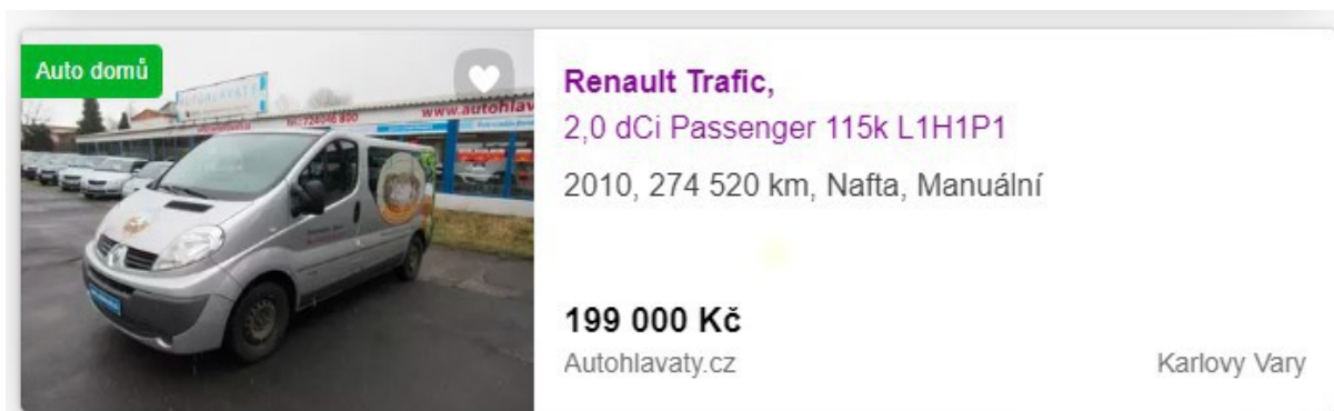
Obr. nabídka obdobného vozidla z trhu (Sauto.cz 5/2023)

plynou dvě hodnoty : 171 900,- Kč 90 909 + DPH = 110 000 Kč prostřední hodnotu „uspokojivý stav“ vylučujeme.