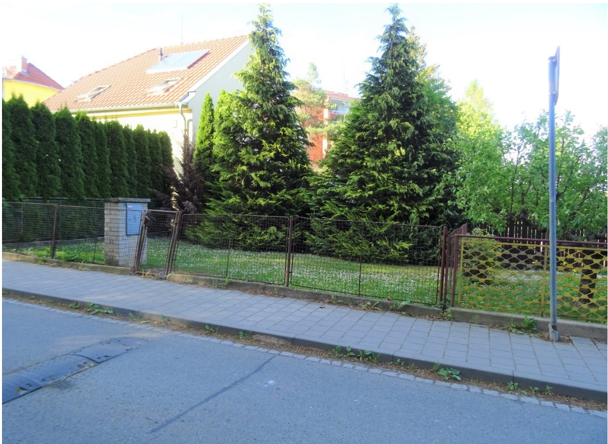
pozemek p.č. 671/2 v k.ú. Bystrc