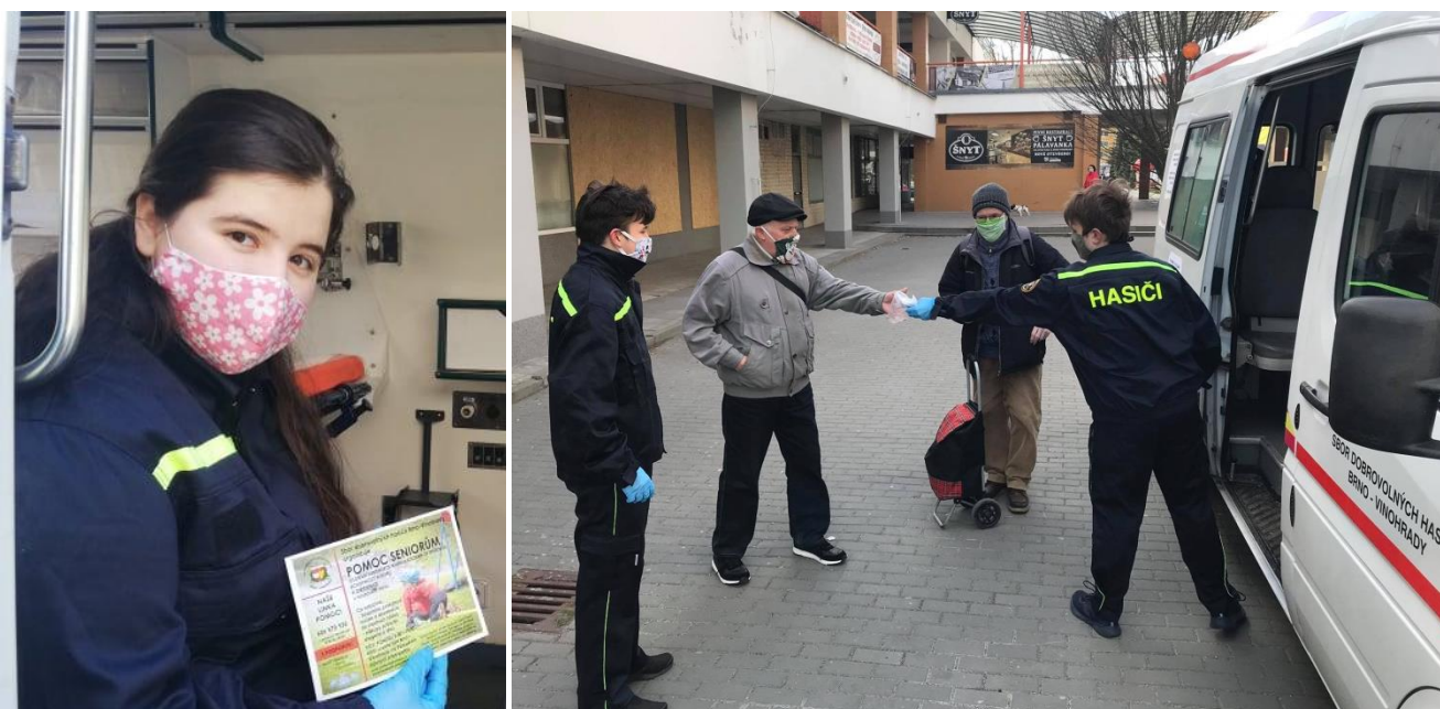
Obr. 6 – Distribuce roušek a dezinfekce na Vinohradech