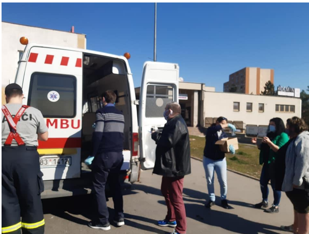
Obr. 4 – Distribuce dezinfekce zdarma

V Řečkovicích dobrovolní hasiči nakoupili a zdarma distribuovali 130 l dezinfekce vyprodukované ve Střední průmyslové škole Chemické a na Fakultě Chemické VUT. Nádoby na dezinfekci občanům jim zdarma poskytl řetězec IKEA.