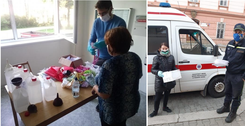
Obr. 2 – Distribuce roušek a dezinfekce v Řečkovících

V MČ Chrlice bylo již před vyhlášením nouzového stavu plánováno na frekventované komunikaci kácení množství přestárých stromů označených dendrologem, u kterých hrozilo značné riziko poškození zdraví osob a majetku. I přes vyhlášená opatření a počáteční obavy z možné nákazy členové SDH Chrlice tyto rizikové stromy pokáceli během 12 hodin. Došlo tak dokonce ke zkrácení uzavírky ulice Roviny.