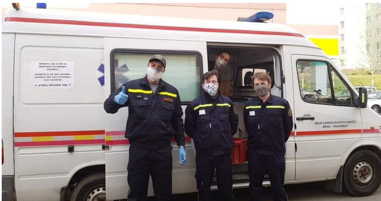
Obr. 5 – Distribuce roušek a dezinfekce na Vinohradech

475 l dezinfekce na ruce. Náklady spojené s pořízením pokryla finanční pomoc od dárců. Distribuce roušek, rukavic a dezinfekce prováděli vinohradští hasiči pravidelně 1x až 2x týdně vždy v otevírací době obchodů pro seniory.