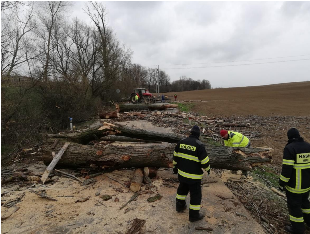
Obr. 3 – Kácení stromů v ulici Roviny

V MČ Chrlice bylo již před vyhlášením nouzového stavu plánováno na frekventované komunikaci kácení množství přestárých stromů označených dendrologem, u kterých hrozilo značné riziko poškození zdraví osob a majetku. I přes vyhlášená opatření a počáteční obavy z možné nákazy členové SDH Chrlice tyto rizikové stromy pokáceli během 12 hodin. Došlo tak dokonce ke zkrácení uzavírky ulice Roviny.