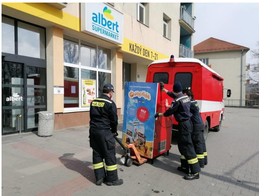
Obr. 1 - Přeprava automatu k distribuci roušek v MČ Královo Pole

Některé Sbory dobrovolných hasičů (dále SDH) zajišťovaly činnosti na základě požadavků z krizových štábů městských částí nebo na základě pokynu vedení MČ. Jednalo se zejména o pomoc s logistickým zajištěním dezinfekce a ochranných pomůcek. V MČ Jundrov a Komín prováděli dobrovolní hasiči dezinfekci prostor úřadů MČ. V MČ Komín a Útěchov prováděli dobrovolní hasiči dezinfekci vybraných zastávek MHD. V Komíně také dezinfikovali dobrovolní hasiči v domově pro seniory.