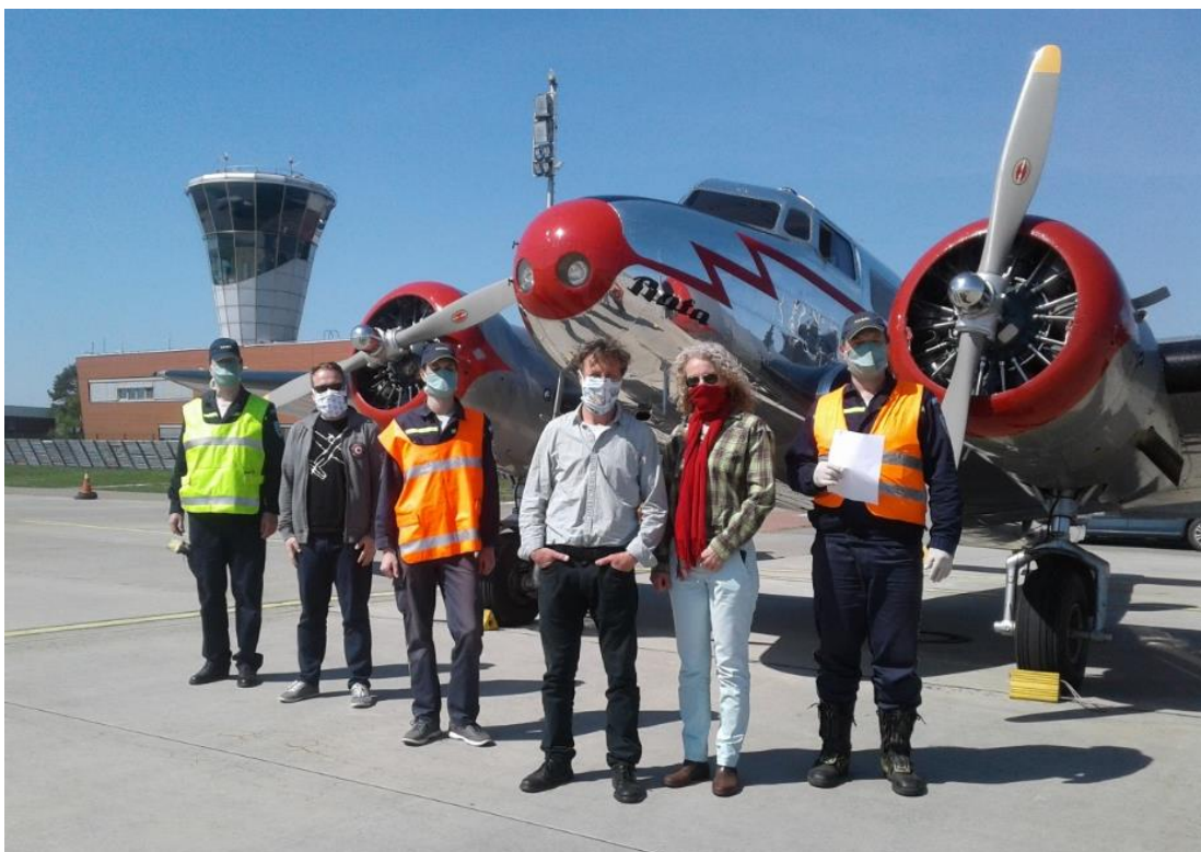
Obr. 7 – Převzetí zásilky zdravotnického materiálu v rámci akce „ Piloti lidem “

SDH Královo Pole a SDH Husovice poskytly součinnost v rámci celostátní akce „ Piloti lidem “. Činnost spočívala v převzetí letecké zásilky zdravotnického materiálu a jeho doručení konkrétnímu zdravotnickému zařízení nebo ordinacím lékařů.