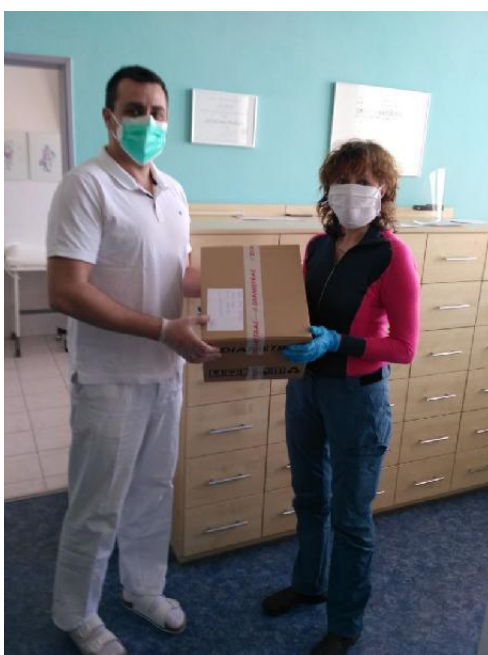
Obr. 8 - Předání letecké zásilky na poliklinice Viniční