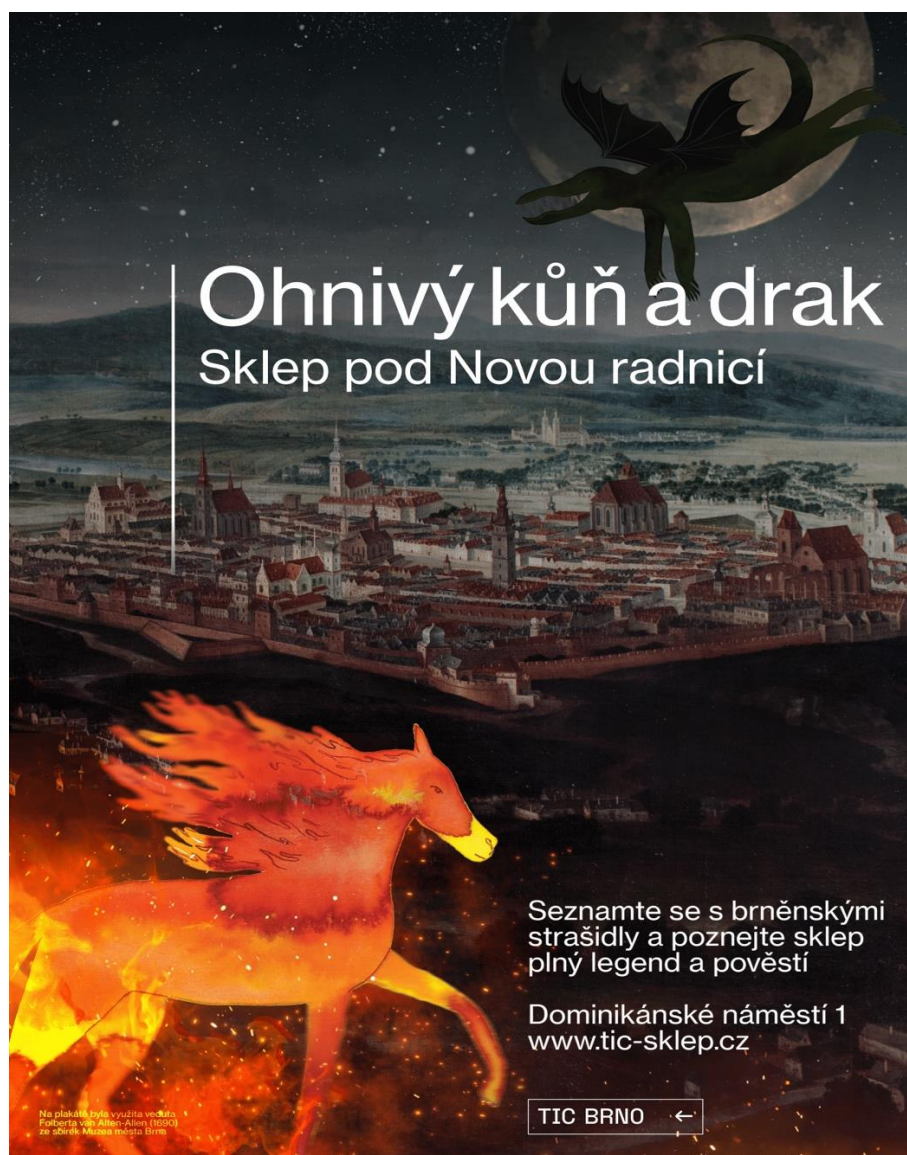
Návrh plakátu k nové expozici

V prostorech Mincmistrovského sklepa bude instalována nová multimediální expozice věnovaná historii Brna (zejména z doby obléhání Švédy) a brněnským pověstem. Expozice bude mít edukativní a zábavní charakter, bude určena především pro rodiny s dětmi a školní prohlídky. Plánované otevření je na jaře 2022.