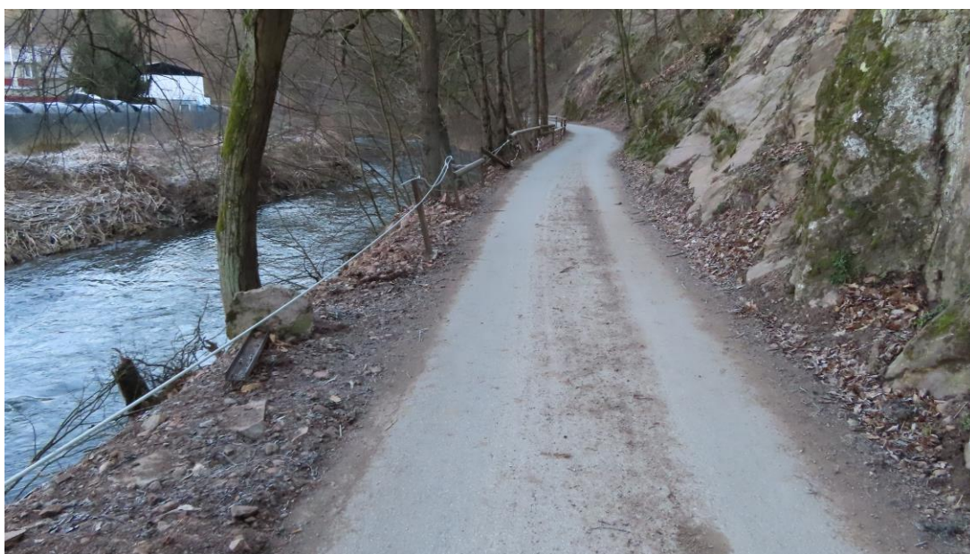
c-V-4 poškození zábradlí u řeky