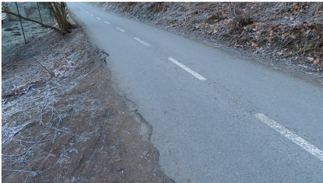
c-V-3 narušení asfaltu cyklostezky