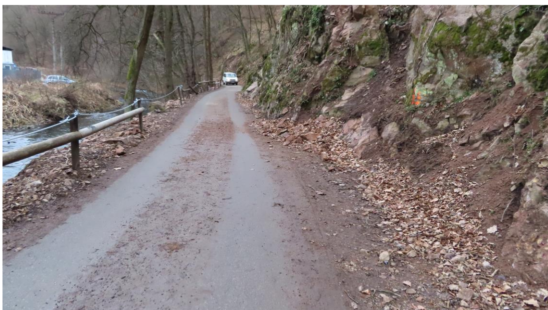
c-V-1 pokračující sesuvy kamenů-místo pro osazení betonových bariér

„Oprava cyklostezky č.5 - Bílovice nad Svitavou - Brno-Obřany, II. etapa“