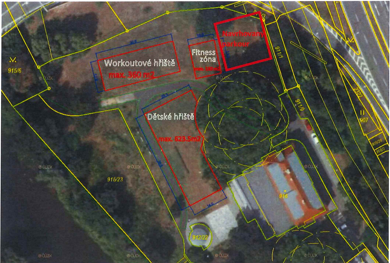
Obrázek – Letecký snímek s vyznačením parcel a zamýšleného umístění parkourového hřiště