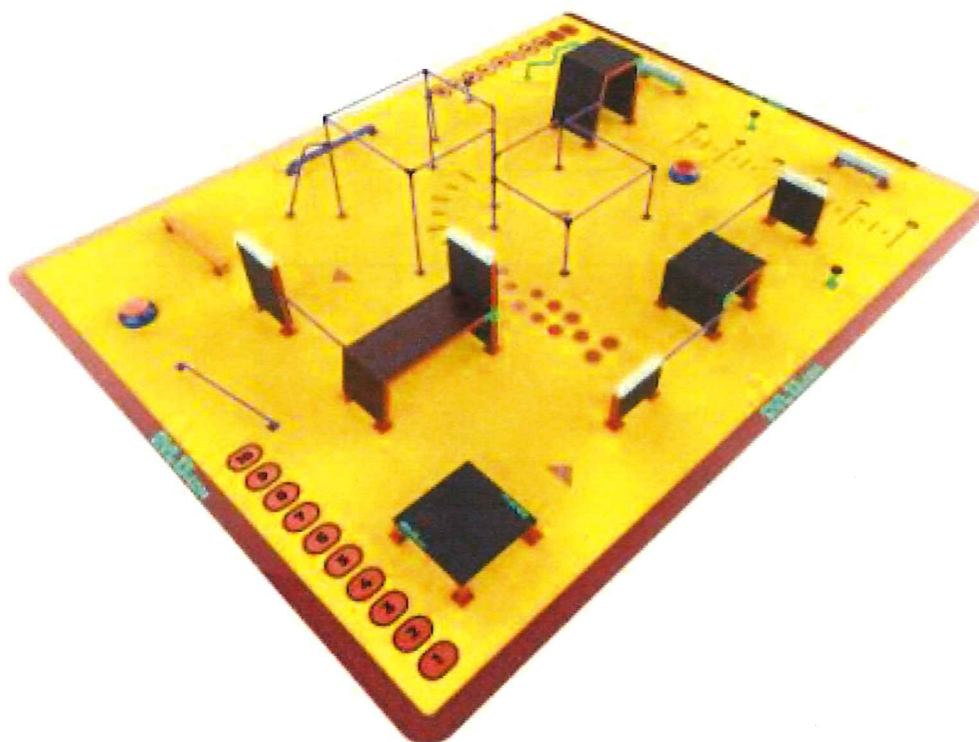
Obrázek – Vizualizace parkourové sestavy

Navržený stav plánovaného parkourového hřiště spočívá v provedení terénních úprav s následným vybudováním betonové základové desky včetně betonových patek. Dopadová plocha hřiště je plánovaná s použitím litého tartanu. Na takto upravenou plochu budou nakonec instalovány prvky pro parkour (překážky).