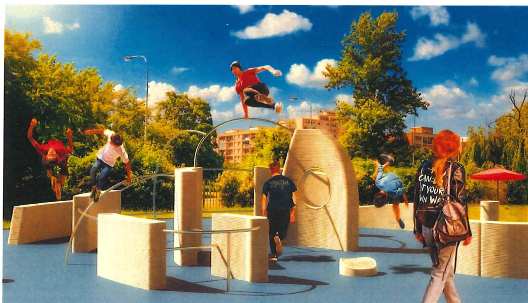
Obrázek – Názorná ukázka parkourového hřiště

V rámci koncepce sportu (plán města Brna do roku 2030) se začala plánovat revitalizace celé sportovně-rekreační oblasti Riviéra-Anthropos. Jedním z cílů bylo rozšíření volnočasových sportovních aktivit na nevyužitých pozemcích Riviéry. V roce 2021 se zde podařilo vybudovat volnočasové workoutové sportoviště "Cvičí celá rodina" (dětské hřiště, workoutové hřiště a zóna pro seniory) a nyní je snaha naplnit koncepci sportu města Brna v podobě výstavby již zmíněného parkourového hřiště.