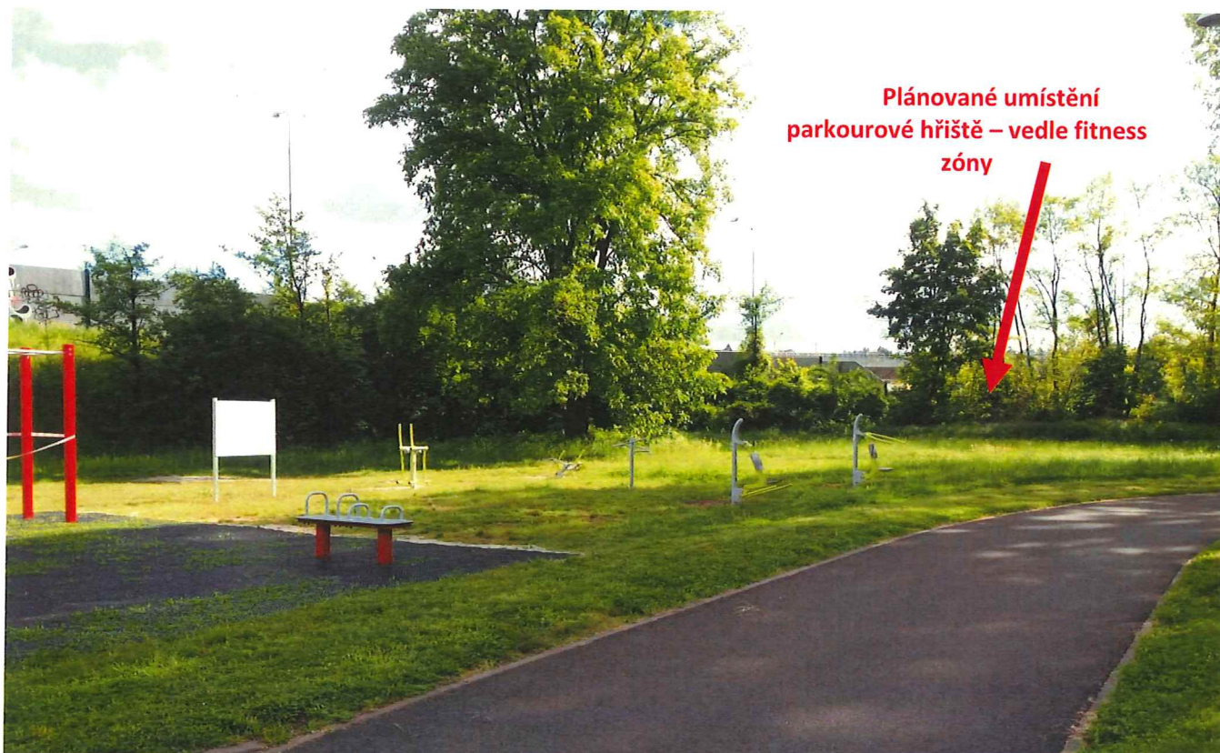
Fotografie – Stávající stav pozemku pro umístění parkourového hřiště

Na stávajících pozemcích střediska Riviéra v Areálu dopravní výchovy je nyní vybudováno samotné dopravní hřiště včetně budovy s moderními učebnami sloužící ke vzdělávání v oblasti dopravní výchovy a volnočasové workoutové sporotoviště “Cvičí celá rodina” (dětské hřiště, workoutové hřiště a zóna pro seniory).