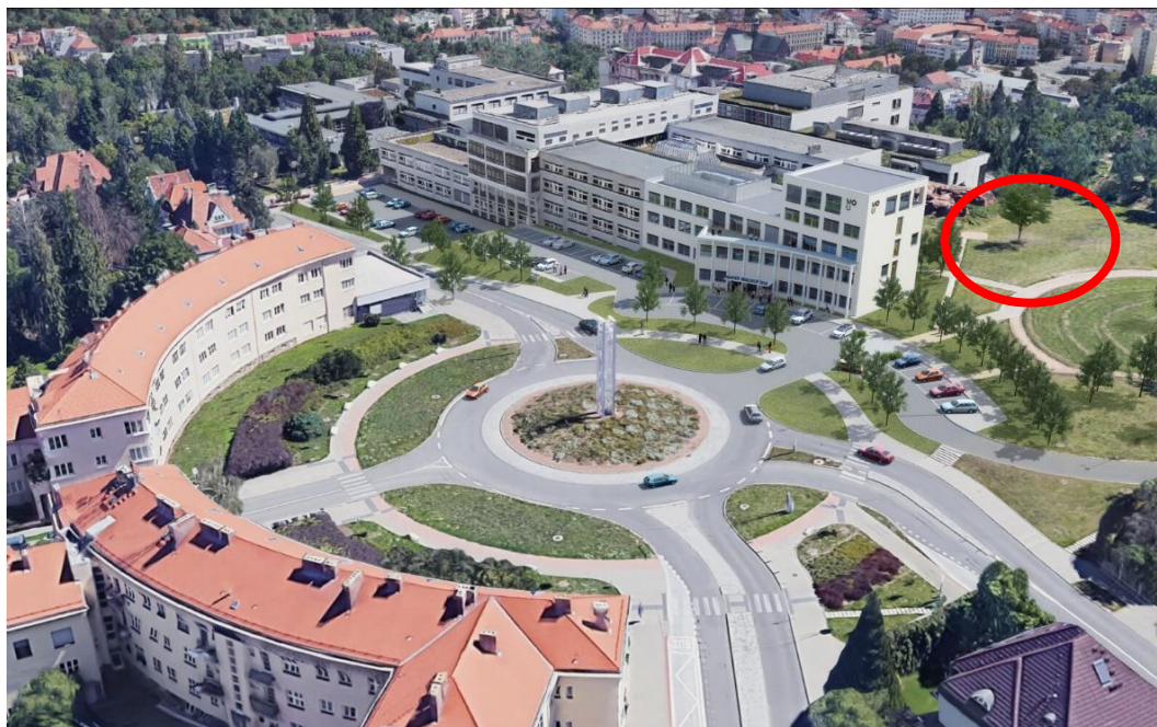
Obr. 2 – Vizualizace Centra pro inovativní a podpůrnou péči

Červeně označené budoucí umístění sochy Lucie Bakešové