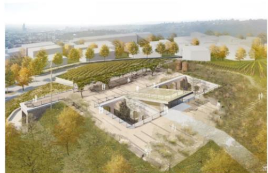
Vizualizace Parku Žlutý kopec na Starém Brně, autoři: Ing. arch. Jakuba Chvojky, Ing. arch. Radka Dragouna