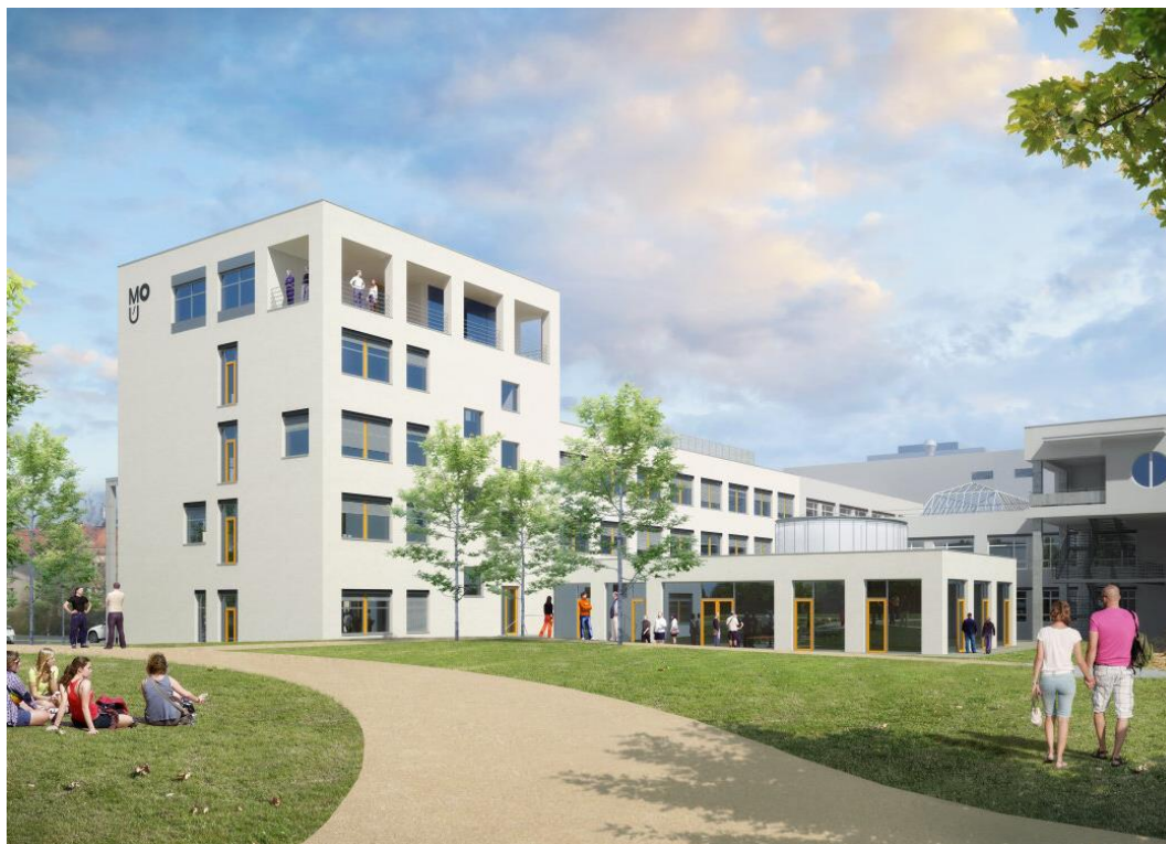
Obr. 1 – Vizualizace zadní (do parku obrácené) části Centra pro inovativní a podpůrnou péči