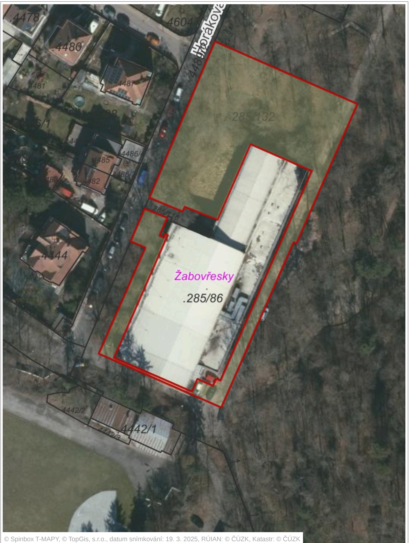
datum snímkování: 19. 3. 2025