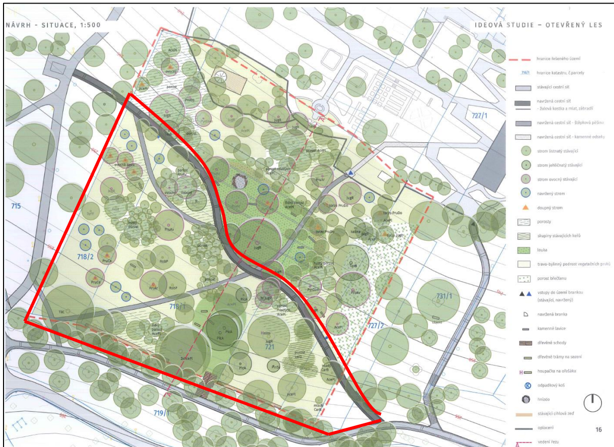
Obr. 3 - Návrh řešení Otevřeného lesa – sever a jih dle studie, autor: Ing. Vít Ondráček, 2022 (červeně vyznačeno území řešené projektovou dokumentací z úrovně VZmB)

Součástí zadání projektové dokumentace bude rozpracování dle vysoutěžené studie Ing. Víta Ondráčka zahrnující sadové úpravy, zpevněné chodníky a opěrnou zídku na nejnižnější části. Předpokládaná částka na realizaci projektu je do 6 000 tis. Kč, nicméně tato částka vychází ze studie z roku 2022 a konkrétní částka vyplyne ze zpracované projektové dokumentace.